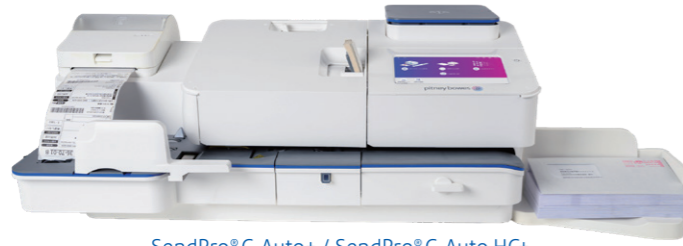
SendPro® C Auto+ / SendPro® C Auto HC+