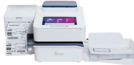
SendPro® C 220+ / SendPro® C 320+