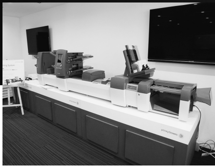
封入封かん機「Relay ® 7000/8000」