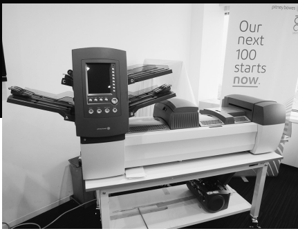
封入封かん機「Relay ® 5000/6000」

SendPro ® Pシリーズは、封筒へのオリジナル広告印刷が可能。郵便物にインパクトを持たせることで開封率を大幅に向上させる。画像データをネットワーク経由でアップロードすれば、ビジネスロゴや差出人住所、プロモーションメッセージなどを封筒に直接印刷できる。ワンポイントの画像から紙面を埋め尽くすほどのデザインまで、希望通りのデザインをその都度印刷することで、印刷済み封筒の在庫が不要となり経費節減につながる。