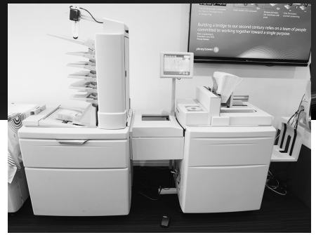
封入封かんシステム「Relay ® 9000」

また、ピツニーボウズのオプションソフトウェア「Relay ® Communications Hub」とシームレスに連動することで、文書作成のワークフローを最適化。既存システムに変更を加えることなく文書にバーコードを直接追加する。郵便番号順並べ替え機能による郵便料金の割引取得支援（区別郵便物）などの便利な機能も利用できる。ページ数の異なる文書を選別せずとも、Relay ® シリーズに文書をセットしてスタートボタンを押すだけで、郵便物の名寄せから紙