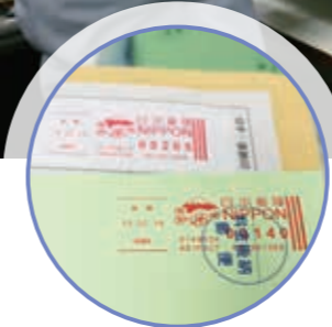
自動で印字された料金と消印

郵便物の承認のもと、封筒に郵便料金と消印を印刷できる機械です。つまり、郵便料金計器に発送物を通せば、切手を貼らなくても